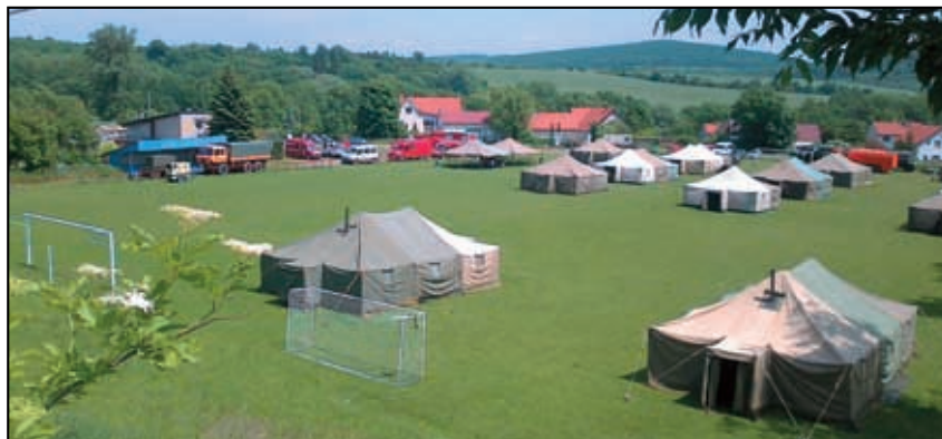
Stanové město Zahořany.

Rád bych osobně poděkoval také fotbalistům Sokola Zahořany, který neváhal poskytnout své hřiště pro vybudování