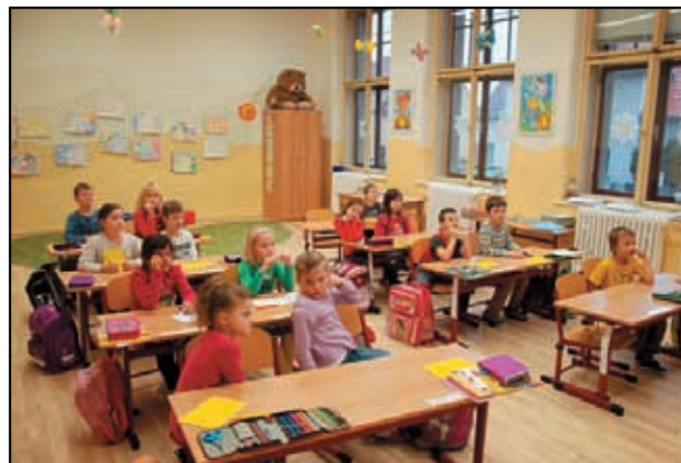
Žáci první třídy.

Děti jsou neuvěřitelně šikovné, zvědavé a plně nápadů. Hlásí se o dobrovolné úkoly, navzájem si pomáhají a hledají nová řešení. V září přišly do školy a většina z nich neuměla číst. Dnes si už čtou knížky. Velkou neznámou pro naši školu bylo zavedení nového písma Comenia Script. Po půl roce můžeme říci - dílo se daří. Děti se učí psát lehce, nácvik trvá minimální dobu a písmo je hned úhledné. Za zmínku stojí zkušenost se žákyní, která 1. třídu opakuje. Loni se učila