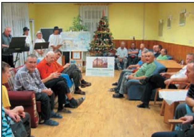
Česko zpívá koledy.