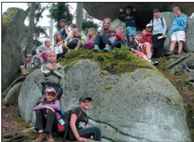
Tábor v Národním parku Šumava.