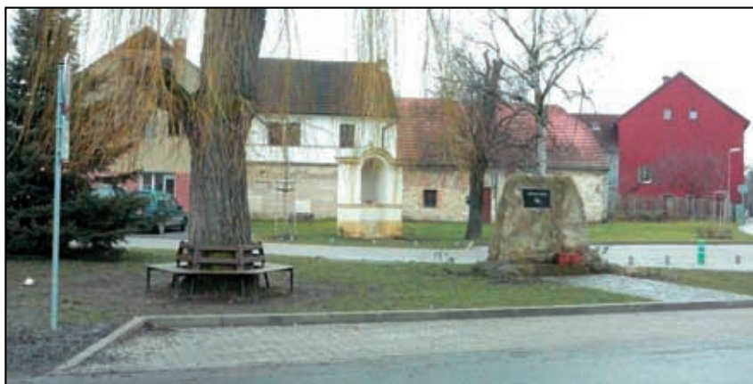
Oživená náves v Zahořanech.