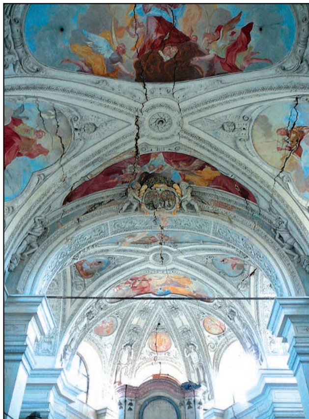
Klenba kostela Nejsvětější Trojice.

Jak dál: Nyní je třeba vrátit se k úvodní fotografii a úvaze o budoucnosti památky. Je-li naším přáním, aby tato stavba byla i nadále dominantou obce, musí být na začátku řečeno, že majitel o tuto stavbu nemá zájem z těchto důvodů: Farnost nemá fámíky, v obci se stará ještě o dva kostely, jen v jednom se pro pár osob slouží mše. Investice do kostela, který je dlouhodobě zanedbáván, a který nikdo z věřících nepotřebuje je a bude pro Římskokatolickou církev at' je to jakkoli zajímavá památka, na posledním místě. Připomeňme si,