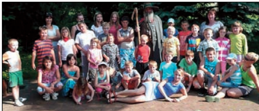
Krakonošovo 8. července 2013

V červenci jsme se sice přestěhovali zpět do naší křešické školky, ale do té malé jsme se vrátit nemohli. Tam začaly stejně jako v našich domovech popovodňové opravy. Díky úžasným sponzorům děti nemusely čekat, až