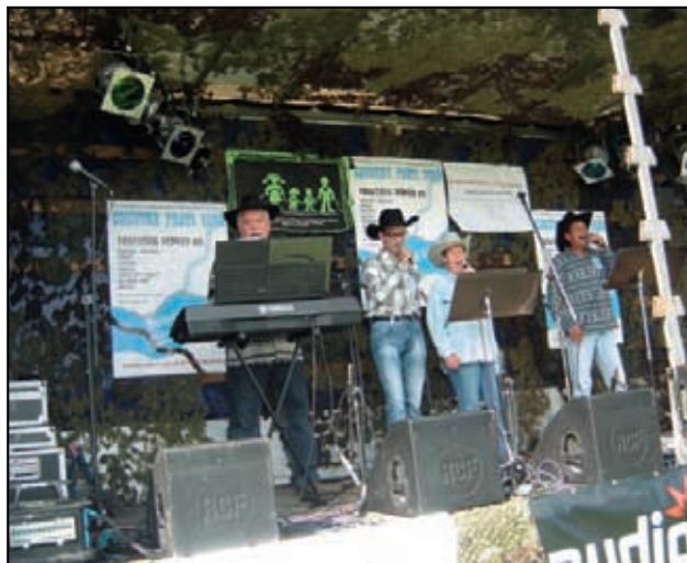
Country proti vodě.

byli žel opět postiženi, nedovolí hned tak zapomenout. K nám Na Pustaj voda našťěstí nedosáhla, ale věřte, že jsme se snažili obci poskytnout pomoc seč jsme mohli. A jsme rádi, že se to i podařilo. O to více jsme se pak snažili zapojit se i my do obecních akcí, které jste především v závěru roku pořádali. Naše Křešičanka - Pustajka se zúčastnila v září festivalu „Country proti vodě“, v předvánočním období jsme měli i svůj malý stánek na vašem Vánočním jarmarku a všichni naši uživatelé se zapojili také 11.12. 2013 do akce „Česko zpívá koledy“, akce, jejíž začátek je spojen také s Křešicemi. 9. prosince jsme uskutečnili v místní základní škole svůj již v pořadí XVI. kulturní pořad „Na Pustaji veselo“ a ani nyní v rámci jeho programu nechyběl školní sbor Sluňáčko. Společných akcí bylo jistě i více a věřím, že budou i následujícími roky a letech pokračovat.