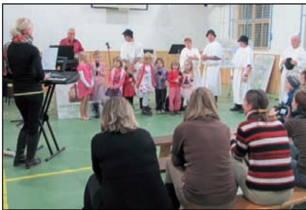
Na Pustaji je veselo.

Na uplynulý rok 2013 jistě hned tak zase nezapomeneme. Červnová povodeň nám to všem a především vám, kteří jste