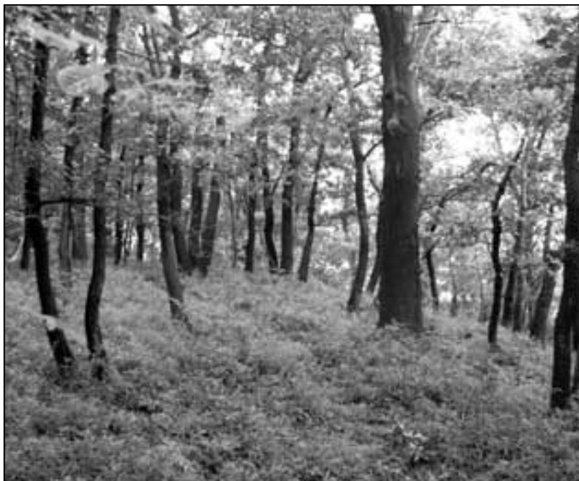
Dubový les na Holém vrchu s bohatým podrostem kamejky modronachové.

Pokud budete mít zájem o další informace, prosím kontaktujte mě na tel.