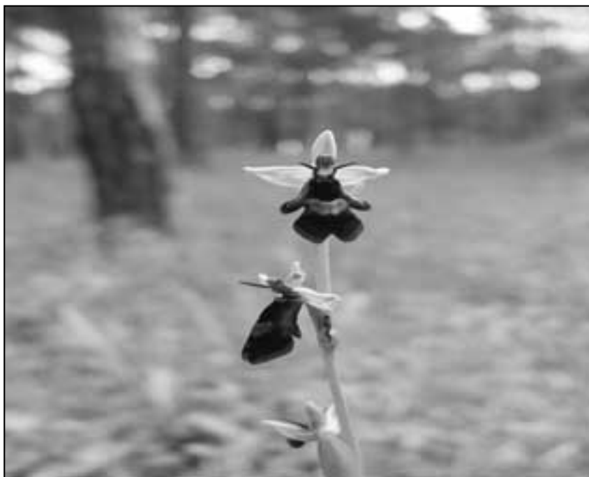
Orchidejovitá rostlina tořič hmyzonošný.

723958486 nebo e-mail jarka.jandova@seznam.cz .