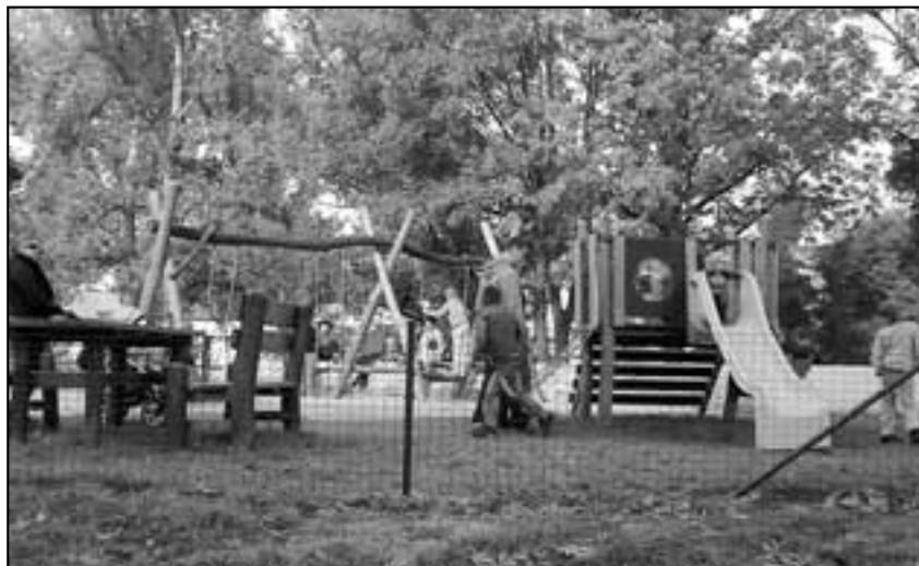
Podařilo se vybudovat dětské hřiště u truhlárny.